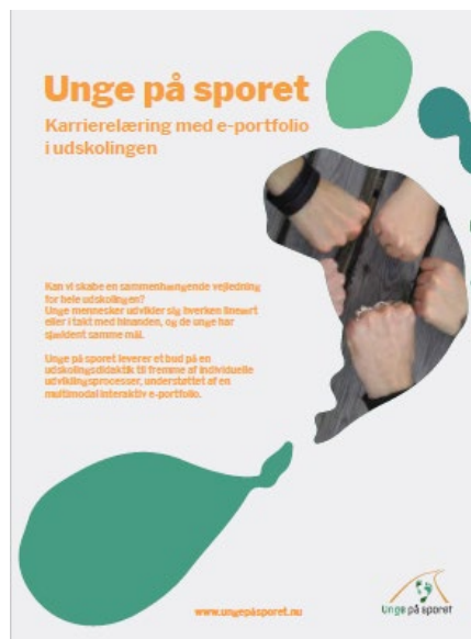
Tilrettelagt af Moeve aps

Endelig er brochuren er publiceret på materialeplatformen.