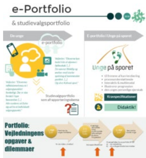
Infoark udarbejdet af Moeve, oktober 2017

Projektet har som endelig målsætning at forsøge at kvalificere den gældende ramme for studievalgportfolioen.